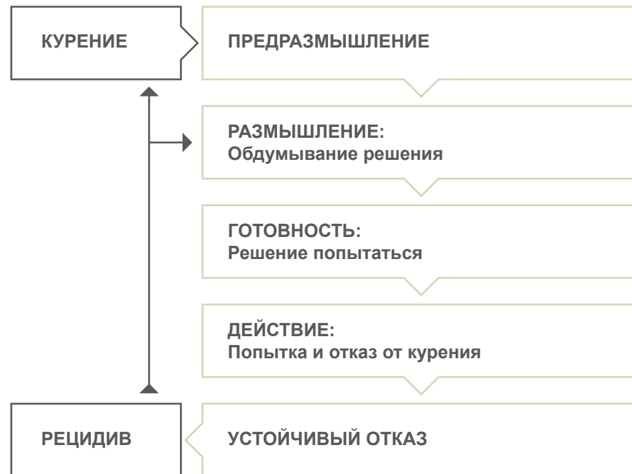
Рис. 2. Схема изменения поведения

Согласно этой модели, в каждый конкретный момент времени курильщики могут переживать одно из четырех состояний относительно решения отказа от курения. Они могут находиться в стадии действия, в стадии готовности, размышления или предразмышления.